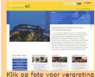
Klik op foto voor vergroting